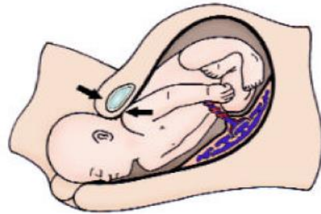
Weithiau ar ôl i'r pen gael ei eni, mae'r ysgwydd yn mynd yn sownd

Caiff babanod y mae amheuaeth bod ganddynt wendid yn eu braich eu hatgyfeirio ar gyfer asesiad Ffisiotherapi a byddant yn cael eu gweld o fewn 10 diwrnod gwaith i'r atgyfeiriad.