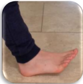
Cerddediad arferol sawdl i flaen y droed