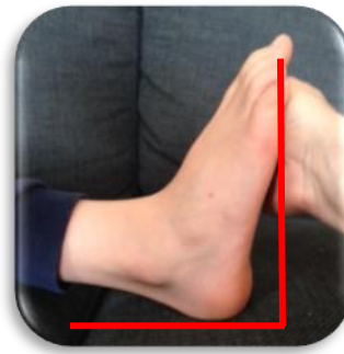
Symudiad cyfyng y ffêr (llai na 90 °)